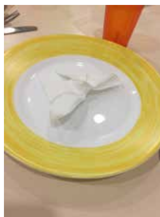
Najlaa Bahsoon Educatrice