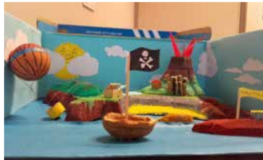
L'Île mystérieuse de Jules Verne