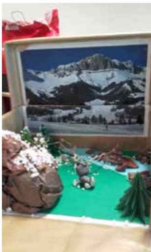
L'Appel de la forêt de Jack London