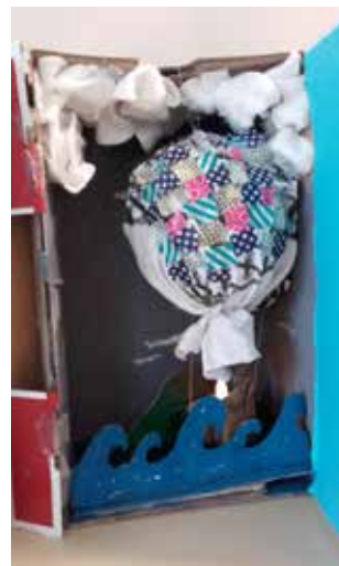
L'Île mystérieuse de Jules Verne